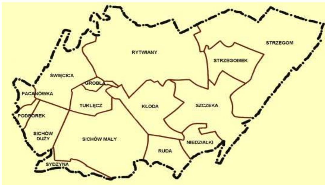
Ryc.1. Mapa sołectw w Gminie Rytwiany

Tuklęcz należała do dóbr rytwiańskich. Jednymi z jej właścicieli byli Izabela i Łukasz Opalińscy, a później ich synowie – Jan i Stanisław Łukasz, którzy toczyli spór o posiadłość po rodzicach. Ostatecznie Rytwiany i przyległe wioski dostały się w posiadanie Stanisława. Kolejnymi właścicielami dóbr rytwiańskich byli Lubomirscy, Potoccy oraz Radziwiłłowie. Rytwiany były głównym ośrodkiem regionu, natomiast przyległe wioski, w tym Tuklęcz, rozwijały się w oparciu o nie.