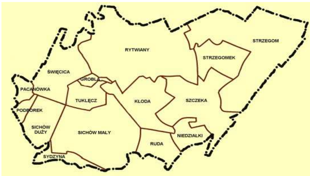
Ryc.1. Mapa sołectw w Gminie Rytwiany

Obecnie Strzegomek liczy 361 mieszkańców. Zagęszczenie wynosi 0,7 osób/ha. Zliczono we wsi 92 budynki mieszkalne (w tym 5 budynków niezamieszkałych).