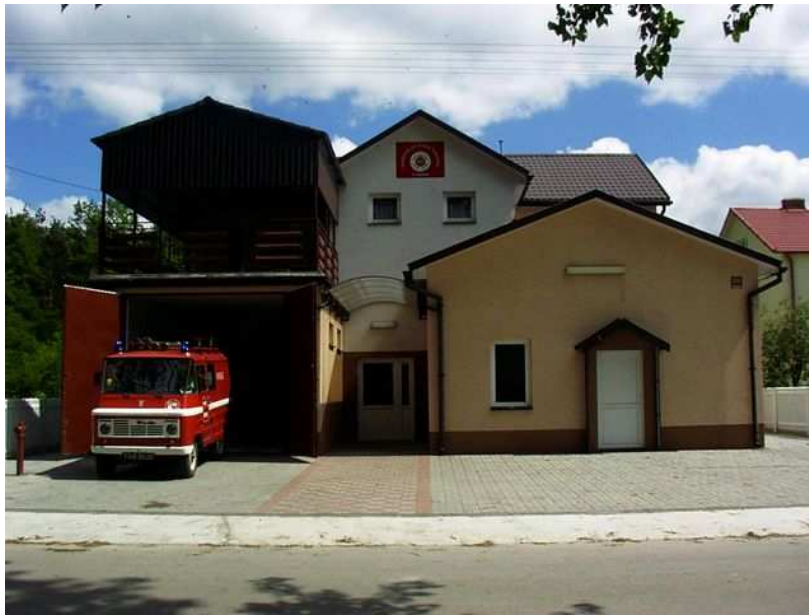
Fot.1. Strażnica OSP w Rudzie po rozbudowie zakończonej w 2003 roku.

Mieszkańcy Rudy są zaopatrywani w wodę pochodzącą z ujęcia wody we własnej miejscowości. Woda ta, pochodzenia czwartorzędowego, występująca w piaskach i żwirach, zawiera zbyt duże ilości pierwiastków takich jak żelazo i mangan. Przekroczenia dotyczą również amoniaku. Surowa woda nie nadaje się do picia. Dodatkowo, woda ta zalega płytko i jest narażona, z uwagi na zbyt słabą izolację warstwami nieprzepuszczalnymi, na zanieczyszczenia antropogeniczne. Zatwierdzone zasoby eksploatacyjne tego ujęcia określone zostały w ilości Q_e = 45 \text{ m}^3/\text{d} . Ujęcie składa się z trzech studni głębinowych, z których woda tłoczona jest poprzez stacje uzdatniania wody i zbiorniki wyrównawcze do odbiorników. Wokół studni wyznaczone są strefy ochrony bezpośredniej w promieniu 10 m od obudowy studni. Pozwolenie wodnoprawne zezwala na pobór wody w ilości Q_{\text{śrd}} = 566 \text{ m}^3/\text{d} . Ujęcie ma opracowaną strefę ochrony pośredniej wewnętrznej (30 m). Wodociąg WZ2 „Ruda” obsługuje, oprócz Rytwian, wszystkie sołectwa w gminie. Sieć wodociągowa SUW Ruda połączona jest z siecią wodociagową Rytwian tworząc układ wzajemnego wspomaganie – dotyczy to przypadków wystąpienia awarii. System wodociagowy obsługiwany jest przez Gminny Zakład Komunalny w Rytwianach. Poniższe tabele prezentują zestawienie charakterystyki sieci wodociagowej oraz zużycie wody w Rudzie za 2007 rok w porównaniu do gminy jako całości.