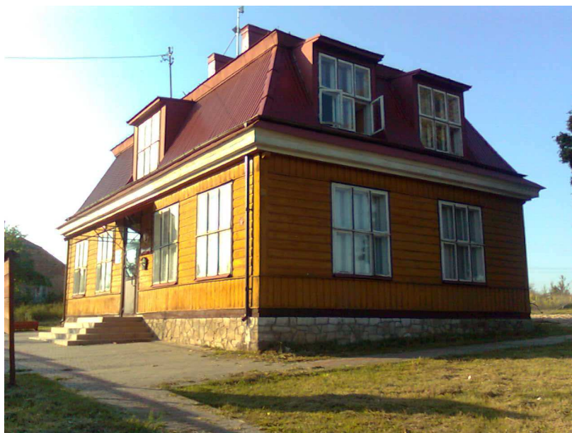
Fot.2. Centrum Kształcenia Na Odległość Na Wsiach w Kłodzie. Budynek dawnej szkoły podstawowej

siłowni, sprzętu rekreacyjnego. W sali komputerowej, z nowoczesnym wyposażeniem (10 komputerów, urządzenie wielofunkcyjne do kopiowania, skanowania i drukowania, faks), można skorzystać z nauki obsługi komputera, oferty różnorodnych kursów i szkoleń (metodą „na odległość”). Nieopodal budynku jest dawne boisko szkolne. Są również we wsi, nieliczne już, domostwa i zagrody powstałe na przełomie XIX i XX wieku.