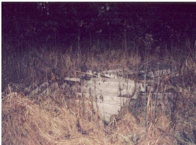
Fot.3. Jedno z „dzikich” wysypisk (widoczne połamane płyty azbestu)

Kłoda nie posiada sieci gazowej. Mieszkańcy korzystają w głównej mierze z gazu bezprzewodowego (butle z gazem). W 2004 przekazana została do eksploatacji magistrala gazowa Staszów – Połaniec. Miejscowości położone wzdłuż wybudowanej sieci gazowej: Rytwiany, Kłoda, Szczeka, Niedziałki, pozyskały doskonałe warunki do rozpoczęcia procedury inwestycyjnej, kompleksowego gazyfikowania swoich miejscowości.