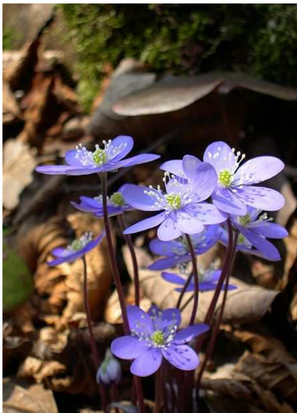
Fot.1. Przyłaszczka pospolita. Od roku 2004 podlega ścisłej ochronie gatunkowej. Jako ładnie kwitnąca wczesną wiosną roślina narażona jest na wykopywanie i przesadzanie do ogródków.

Niewielki fragment lasów i gruntów sołectwa należy do Jeleniowsko – Staszowskiego Obszaru Chronionego Krajobrazu, utworzonego na podstawie rozporządzenia Wojewody Świętokrzyskiego z dnia 29 października 2002 roku. Obejmuje on niewielki fragment północnej części sołectwa. Takie obszary wyznacza się by chronić atrakcyjne i wyróżniające się krajobrazowo tereny, o mało zniekształconym środowisku przyrodniczym. Obszary te są naturalnym korytarzami ekologicznymi dla zwierząt, zaś dla ludzi mogą być bazą aktywnej turystyki i wypoczynku. Dodatkowo, na terenie wsi rośnie dąb szypułkowy, przekraczający w obwodzie 5 m i wysokości 20 m, który jest objęty indywidualną formą ochrony przyrody (1960).