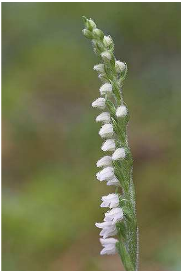
Fot.1. Tajęża jednostronna. Roślina umieszczona na Czerwonej Liście Roślin i Grzybów Polski (2006) w grupie gatunków wymierających na izolowanych stanowiskach, poza głównym obszarem występowania.

W Szczecinie znajduje się jeden obiekt cenny ze względów historycznych. Jest to budynek kaplicy. Historia świątyni, w której znajduje się zabytkowy krzyż, ma niejednorodną genezę. Według jednej, krzyż znajdujący się obecnie w kaplicy, miał być przyniesiony tu przez powódź. W miejscu gdzie osiadł, na pagórku, mieszkańcy wybudowali kaplicę. Druga z legend mówi, że krzyż przywieźli Szwedzi w czasie, gdy wojsko króla Karola XII ciągnęło z Krakowa w kierunku Lublina i Zawichostu. Były to czasy trwania wojny północnej (1701-1709). Sam król miał w nocy z 1 na 2 grudnia 1702 roku zanoć w Szczecinie. W towarzyszących mu taborach wiezony był zrabowany w jednym z kościołów krzyż, który z nieznanych powodów zakopano na niewielkim wzniesieniu we wsi. W czasie jednej z gwałtownych burz, krzyż został wymyty i odsłonięty. Mieszkańcy Szczeki w tym miejscu postawili kaplicę. Krzyż od tego czasu ma chronić okolice przed kataklizmami i klęskami. Obecnie wyremontowana i odbudowana kaplica jest miejscem niedzielnych mszy i nabożeństw.