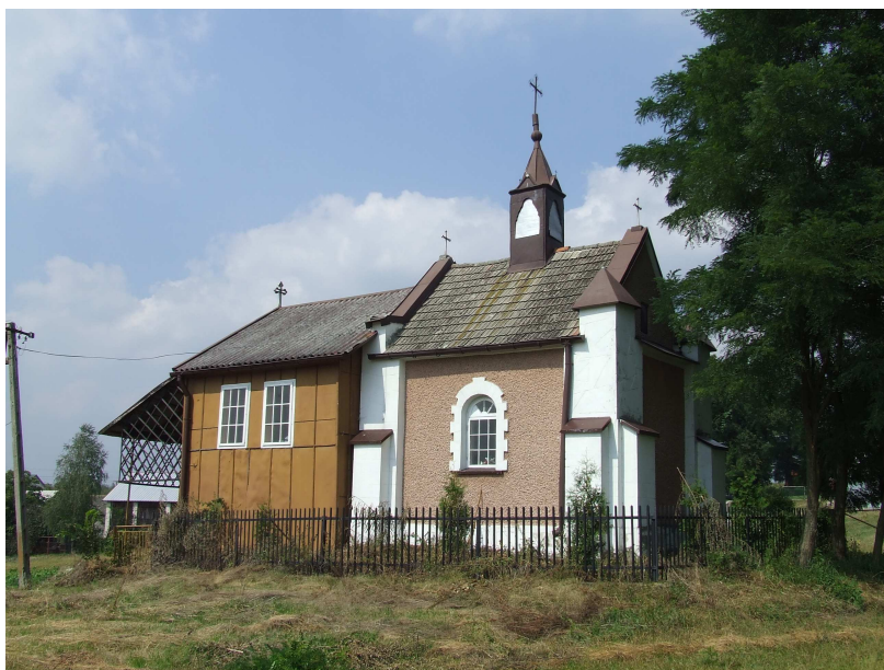
Fot.2. Kaplica w Szczecze. Budynek tuż przed generalnym remontem i odbudową.