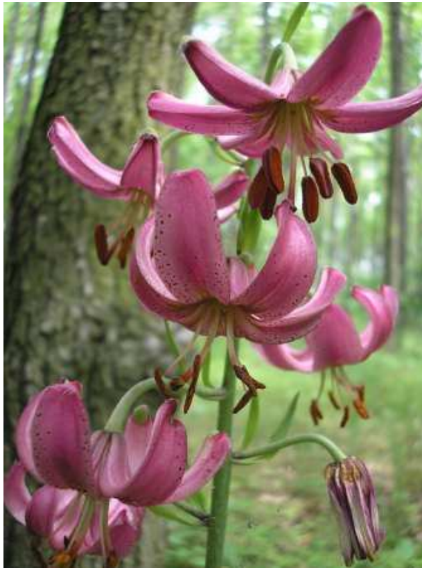
Fot.1. Lilia złotogłów. Roślina objęta w Polsce ochroną ścisłą. Jej piękne kwiaty były i są przyczyną znacznego jej wyniszczenia na siedliskach naturalnych.