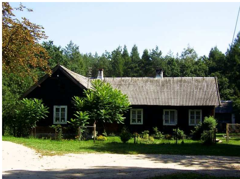
Fot. 2. Zabytkowa drewniana leśniczówka w Sichowie Małym