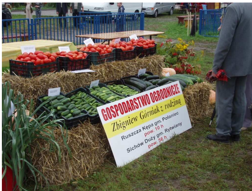
Fot.3. Warzywa z gospodarstwa rolnego „Górniaki”

Największym gospodarstwem w sołectwie jest, prowadzone od 2000 roku, gospodarstwo rolne „Górniaki”. Jego powierzchnia wynosi 85 ha. Specjalizuje się w produkcji warzyw, owoców i zbóż i jest nastawiona głównie na przemysł przetwórczy. Sprzedaż kierowana jest głównie na rynki zagraniczne (USA, Kanada, Izrael, Rosja, Ukraina). Łączna produkcja z gospodarstwa wynosi 1000 – 1500 ton żywności.