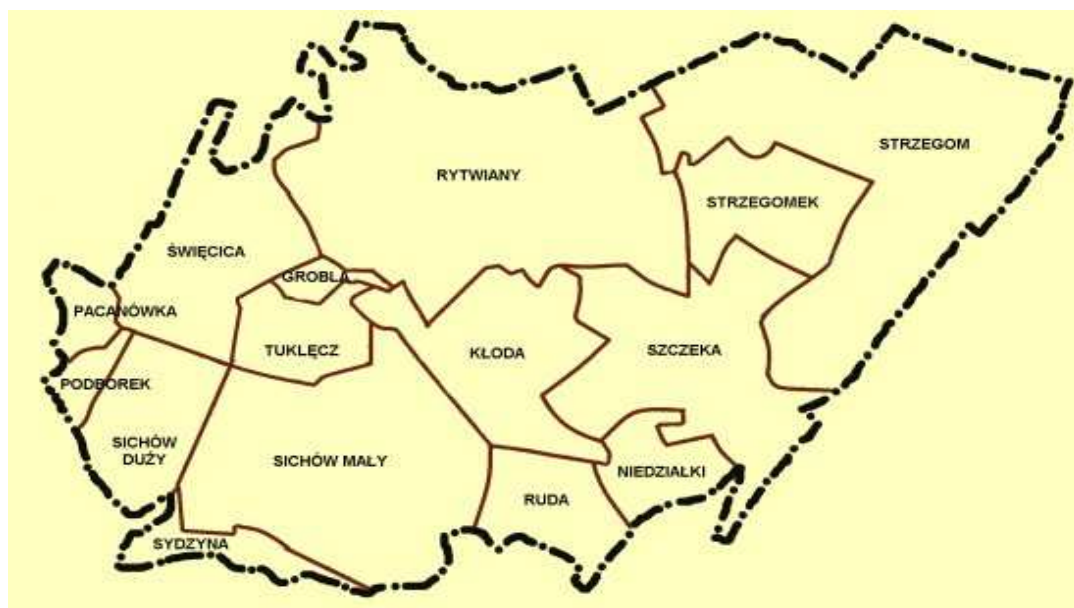
Ryc.1. Mapa sołectw w Gminie Rytwiany

Liczba ludności Niedziałek wynosi 194. Średnie zagęszczenie – 0,6 os/ha. Zliczono we wsi 47 budynki mieszkalne (w tym 10 budynków niezamieszkałych bądź w trakcie budowy).