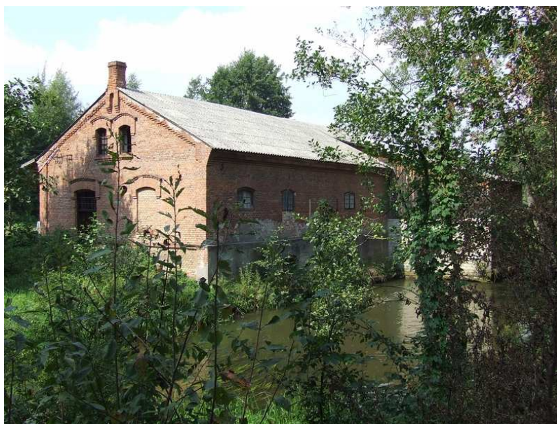
Fot.1. Zabytkowy młyn w Niedziałkach

Na terenie Niedziałek jest szereg domostw i budynków gospodarczych wybudowanych końcem XIX i początkiem XX wieku. We wsi jest około 7 zagród powstałych w latach 1870 – 1930. Niewątpliwie, najcenniejszym obiektem historycznym jest młyn wodny, budynek murowany, powstały w drugiej połowie XIX wieku. Dziś stanowi własność prywatną.