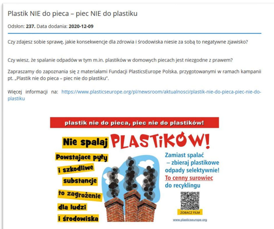
Fig. 3. Przykładowy artykuł w ramach edukacji ekologicznej przeprowadzanej za pomocą strony internetowej Gminy Rytwiany.